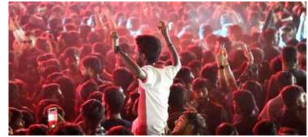
CREATIVITY TO THE FORE. Orange economy refers to that part of the economy that's driven by creativity, culture and intellectual property (AKHILA EASWARAN)

It includes activities where value comes primarily from ideas, knowledge, artistic expression and cultural content, rather than from physical goods. The concert economy —